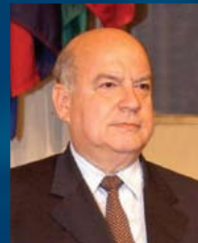
Secretario General José Miguel Insulza

Antigua y Barbuda Guyana Argentina Haití Las Bahamas Honduras Barbados Jamaica Belize México Bolivia Nicaragua Brasil Panamá Canadá Paraguay Chile Perú Colombia San Kitts y Nevis Costa Rica Santa Lucía Cuba* San Vicente y las Granadinas Dominica Suriname República Dominicana Trinidad y Tobago Ecuador Estados Unidos de América El Salvador Uruguay Grenada Venezuela Guatemala